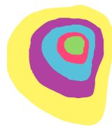
Cuadro 2: Equipos y departamentos de orientación educativa.

Asimismo, en cuanto a los equipos de orientación educativa y departamentos de orientación educativa y profesional, podemos observar que, según los actuales decretos, las funciones de equipo y departamento de manera específica son las siguientes (véase cuadro 2):