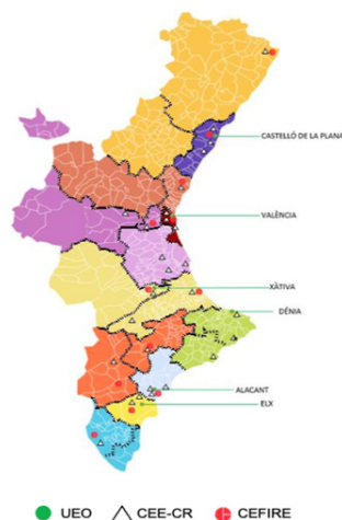
Cuadro 3: Organización de la Orientación educativa curso 2021-2022

Fuente: https://ceice.gva.es/es/web/inclusioeducativa/orientacio