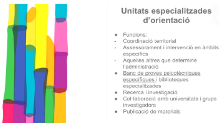
Cuadro 4: Unidades especializadas de orientación educativa